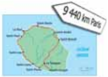
La Réunion – 242 officines