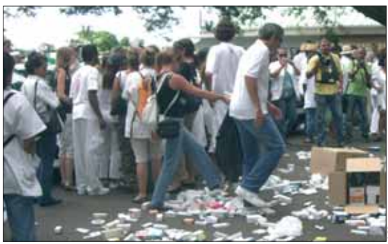
Tout un symbole : les pharmaciens réunionnais déversent des boîtes de médicaments