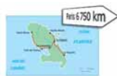
Martinique – 149 officines